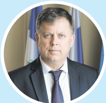
Уважаемые жители Черемховского района!

Примите самые теплые поздравления со светлым праздником Воскресения Христова - Святой Пасхой!