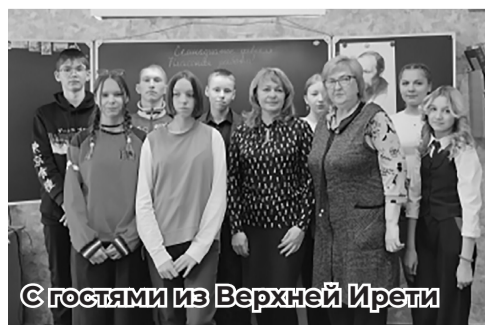
С гостями из Верхней Ирети