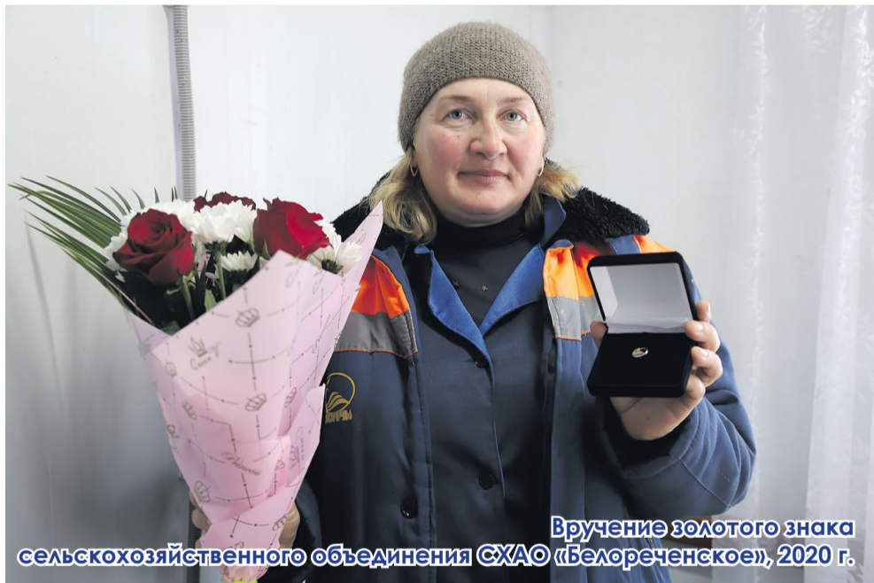
Вручение золотого знака сельскохозяйственного объединения СХАО «Белореченское», 2020 г.