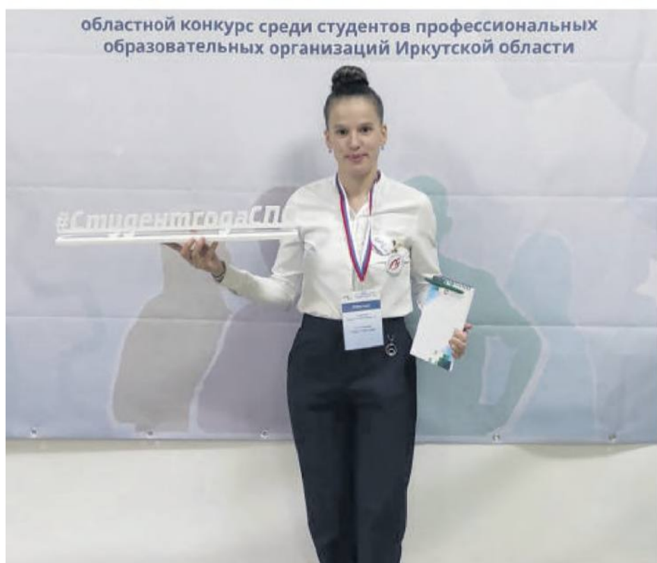
областной конкурс среди студентов профессиональных образовательных организаций Иркутской области