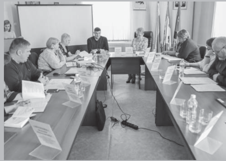
Во время заседания Думы ЧРМО