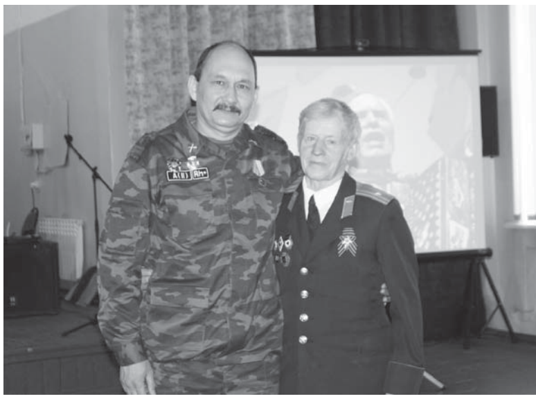
Во время мероприятия

Прошел праздник особенно волнительно, с большой теплотой. Задолго педагоги и дети готовились к этому мероприятию: выбирали и разучивали песни военных лет, продумывали форму, элементы инсценировки, оформление зала. В празднике нашла отражение история Великой Отечественной войны. Звучали песни военных и послевоенных лет, а также песни современных авторов. А с каким интересом учащиеся слушали выступление