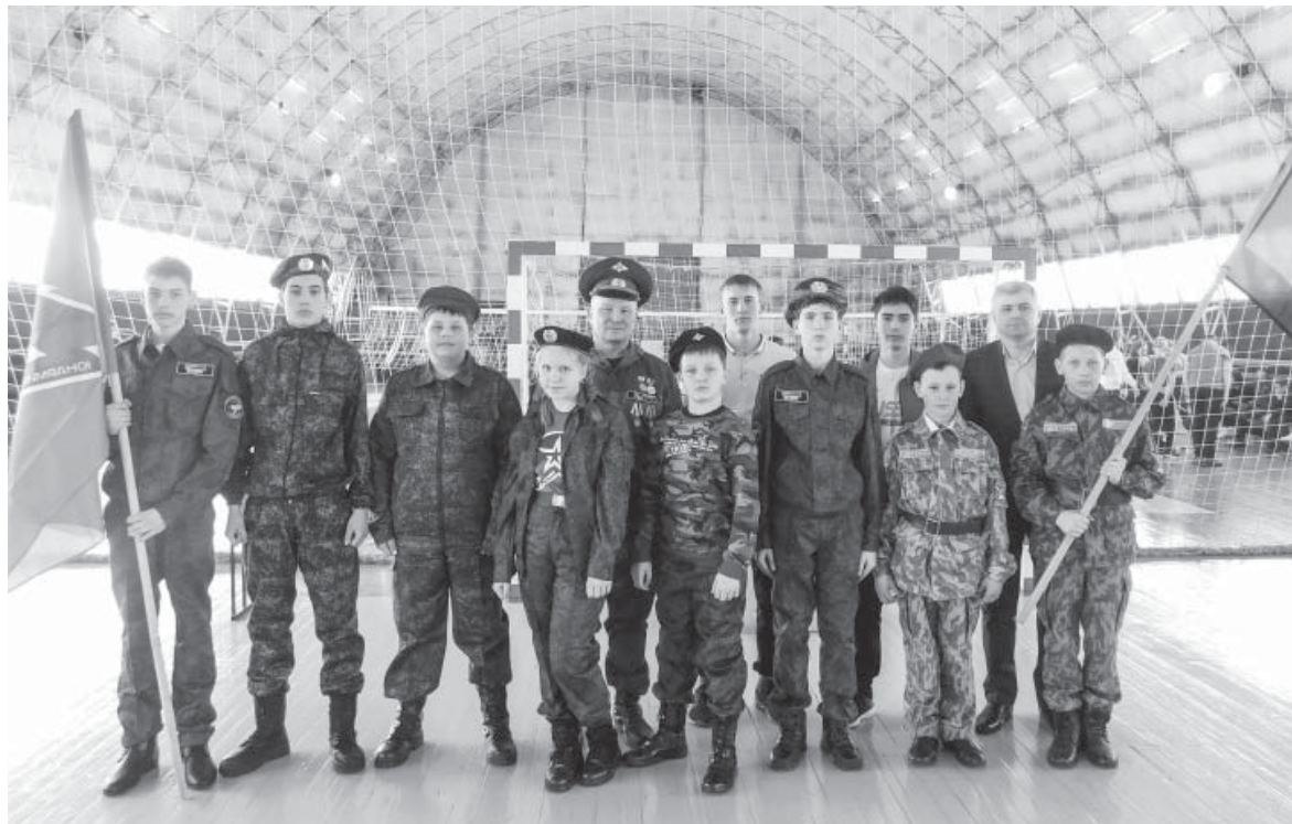
Юнармейцы из Узкого Луга

«Юнармия» – это всероссийское военно-патриотическое общественное движение, созданное 29 октября 2015 года, входит во «Всероссийское движение школьников». Его основная цель – повышение интереса у молодого поколения к истории России, патриотическое воспитание и подготовка к армии. В Черемховском районе на прошлой неделе в юнармейцы приняли около 50 учеников школ Михайловки, Узкого Луга и Голумети.