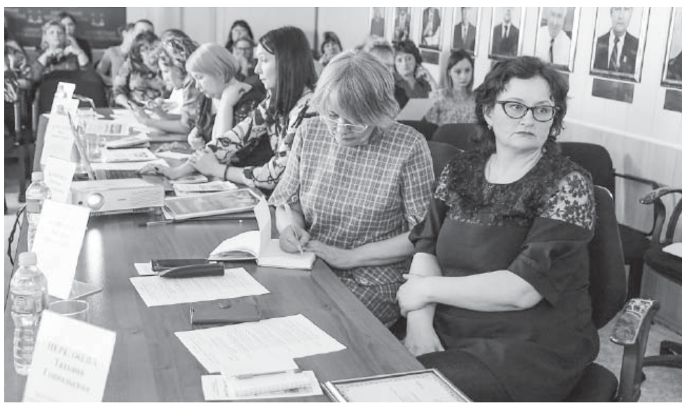
Семинар для участников НКО

«В Иркутской области на сегодня зарегистрировано более 3200 НКО. Большинство из них живёт активной жизнью, имея на реализацию своих дел финансовые средства и иные ресурсы. В этом году уже почти