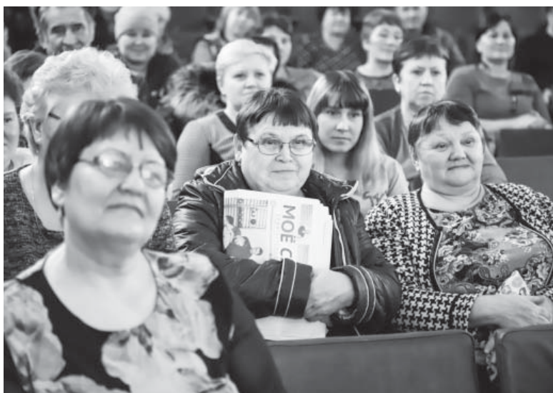
Во время отчета главы Черемховского МО

В работе совещания приняли участие мэр Черемховского района, руководитель аппарата районной администрации, начальники отраслевых отделов, главный врач «Черемховской городской больницы № 1», представители МО МВД России «Черемховский».