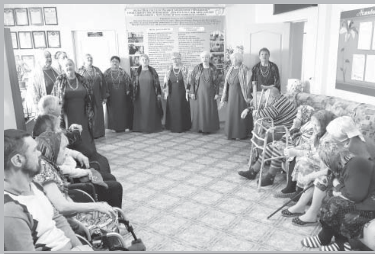
Веселый автобус в Черемхово

В теплый январский день «веселый автобус» вновь отправился в путешествие. На этот раз в «Дом-интернат для престарелых и инвалидов г. Черемхово и Черемховского района». Там состоялся праздничный концерт «Морозное дыхание метели».