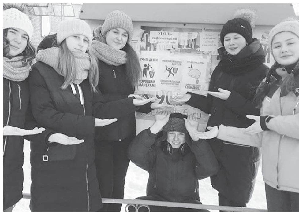
Воспитанники ДШИ посёлка Михайловка