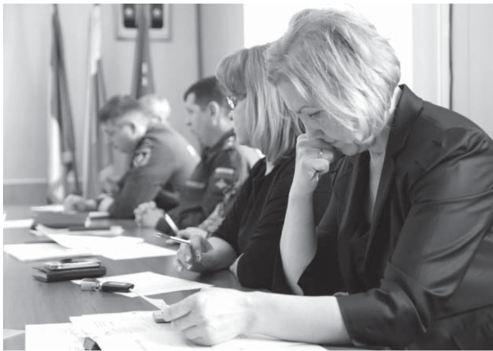
Во время совещания