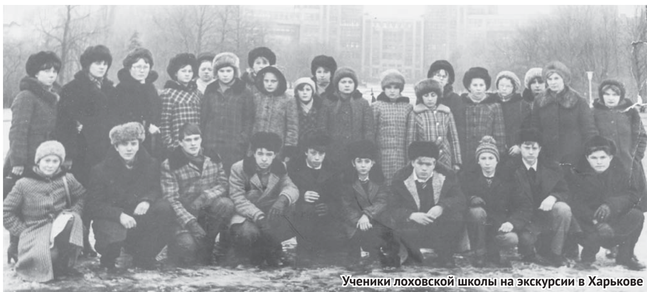
Ученики лоховской школы на экскурсии в Харькове

разлетелись далеко от родного села, но я всех помню. Радостно и тепло на сердце от того, что и меня не забывают – поздравляют с праздниками, пишут, звонят, встретив на улице, обязательно поинтересуются как мои дела, здоровье. Хорошие выпускники в лоховской школе во все времена были, я об этом всегда говорю», - с тоской по трудовому времени говорит моя собеседница.