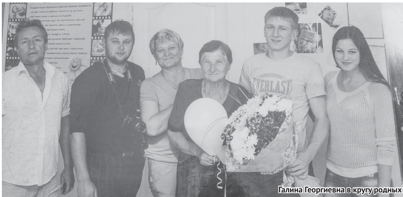
Галина Георгиевна в кругу родных

«Многие мои ученики выросли достойными людьми,