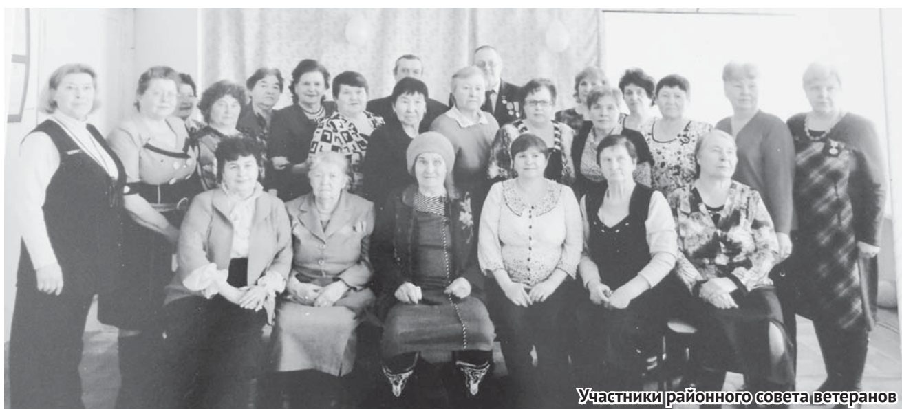
Участники районного совета ветеранов