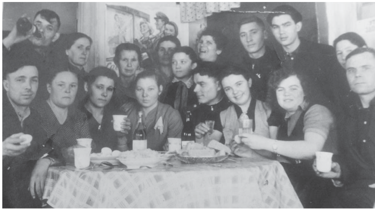
Молодость в Унене