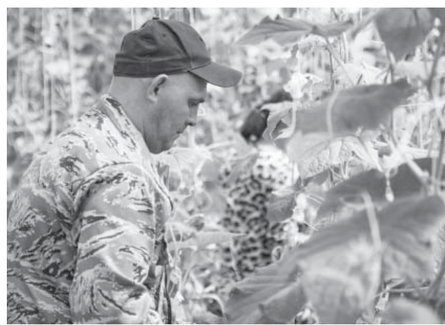
На обработке огурцов