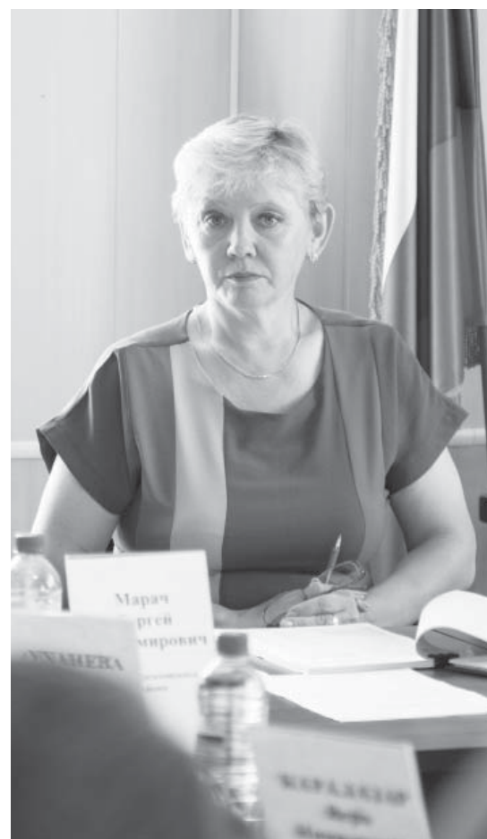
В ходе заседания Думы