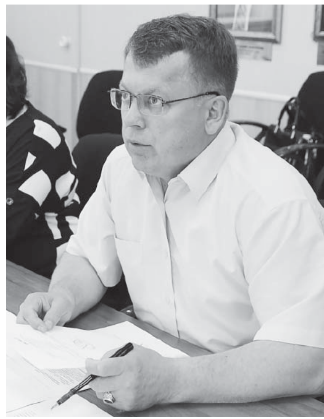
Во время совещания