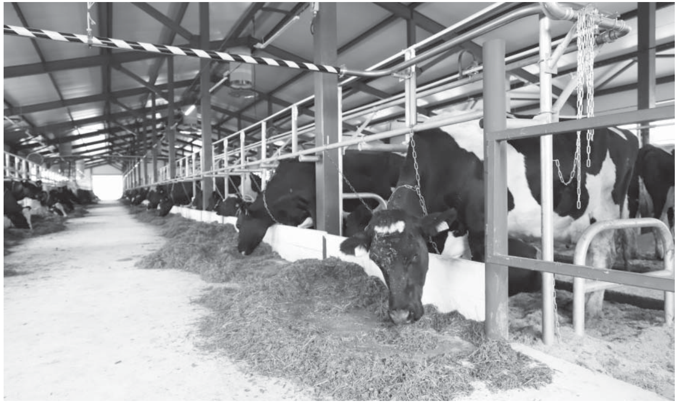
В одном из корпусов табукской молочно-товарной фермы

систему вентиляции. Последнее, по словам Евгения Корбовского, необходимо для снижения температуры внутри помещения в летний период. Зимой новая система вентиляции поможет значительно уменьшить содержание аммиака в воздухе.