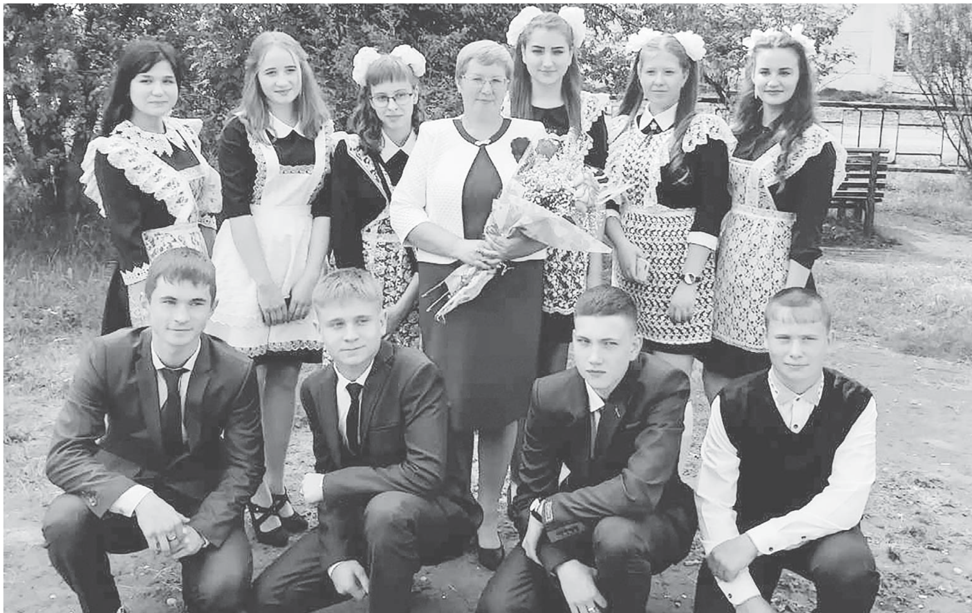
Выпускники 11 класса школы села Лохово