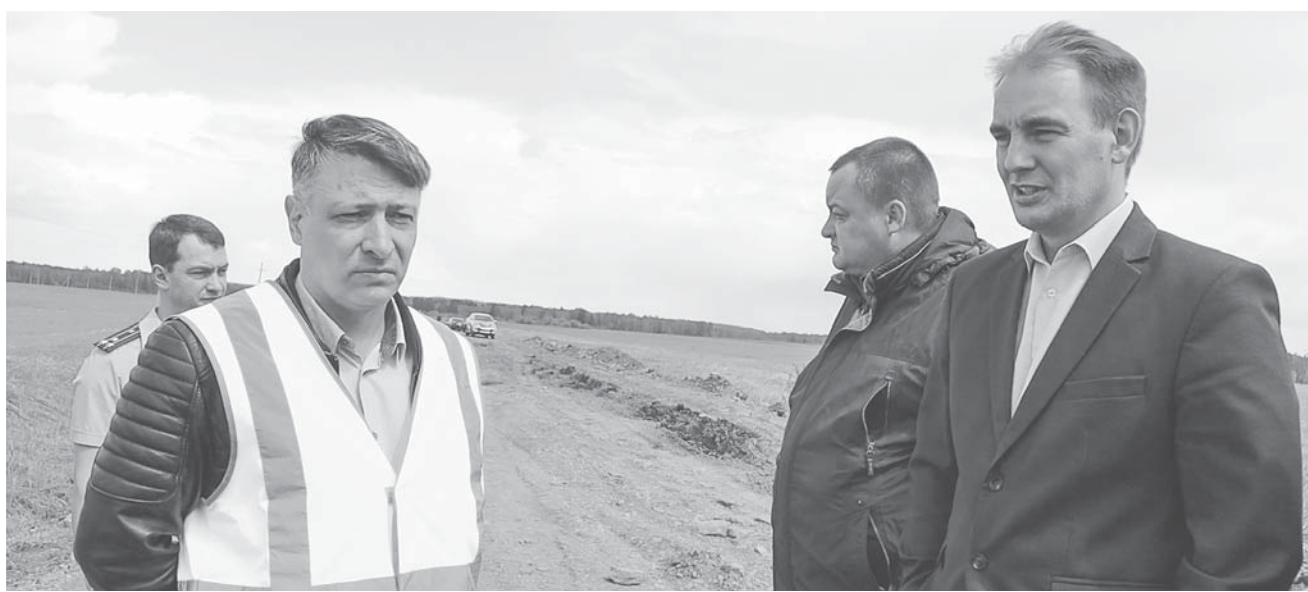
Во время выездного совещания

После войны церковь стала для местных жителей клубом, а потом её закрыли. Уже в 2000-х местную реликвию хотели перевезти в архитектурно-этнографический музей «Тальцы», но народ отстоял святыню, надеясь на её скорое