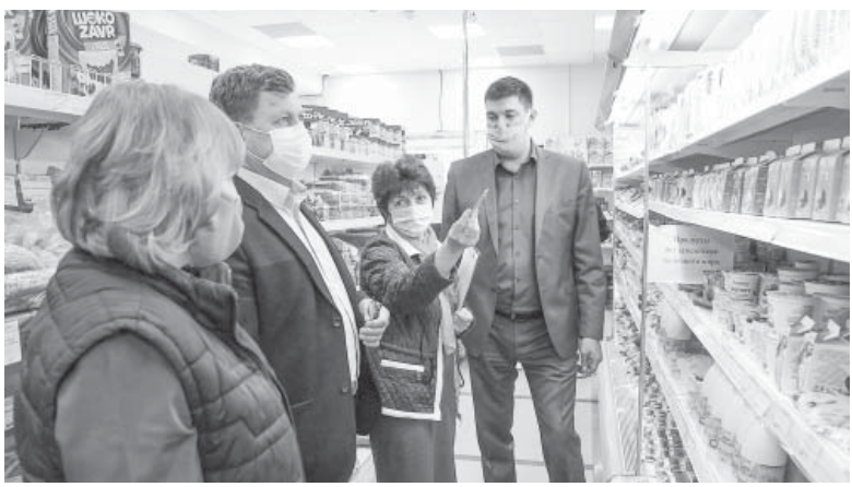
В одном из магазинов посёлка Михайловка