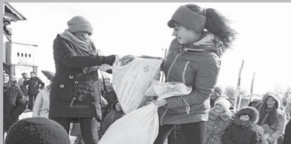
Празднование Масленицы в Нижней Ирети

Масленица – это весёлые проводы зимы, с радостными гуляниями и песнопениями. Даже блины, незаменимый атрибут этого праздника, имеют особое значение: круглые, румяные, горячие, они символизируют солнце, которое светит всё ярче и удлиняет продолжительность дня.