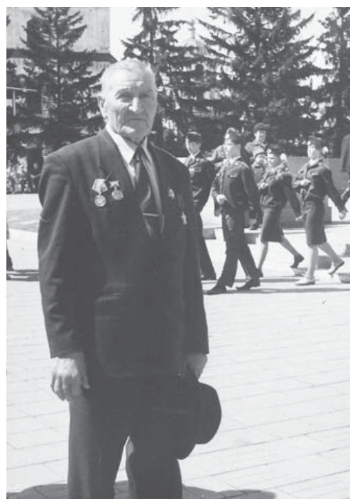
Краеведы школы д. Верхняя Иреть