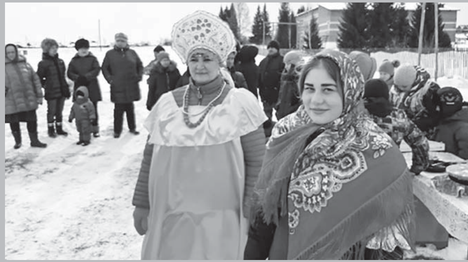
Во время праздника

Наш современный мир находится в постоянном движении вперед. Всё суетливее становится повседневная жизнь людей. Но так же как и во все времена народ провожает зиму и встречает весну с весёлыми песнопениями, частушками, плясками, конкурсами, играми и, конечно же, с блинами.