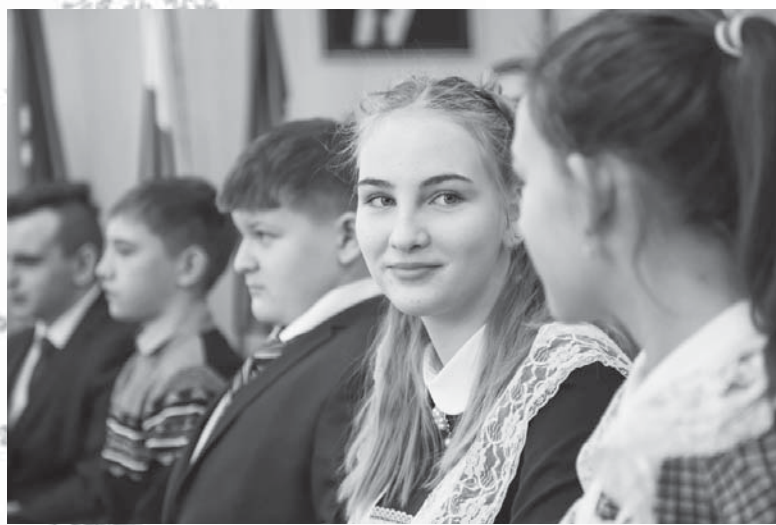
Во время торжественного вручения паспортов

- Сегодня вы становитесь полноправными гражданами нашей великой страны с большой историей. Этот факт знаменует начало вашего взросления, самостоятельности, потому что настоящий гражданин - это человек, который не только пользуется конституционными правами, но и принимает на себя высокую меру ответственности, обязательств перед государством, обществом, перед родными и близкими, который не отделяет свои успехи от жизни Отечества, делает всё для ее процветания, укрепления мощи и авторитета. Несмотря на юный возраст, вы уже многого успели добиться в различных областях.