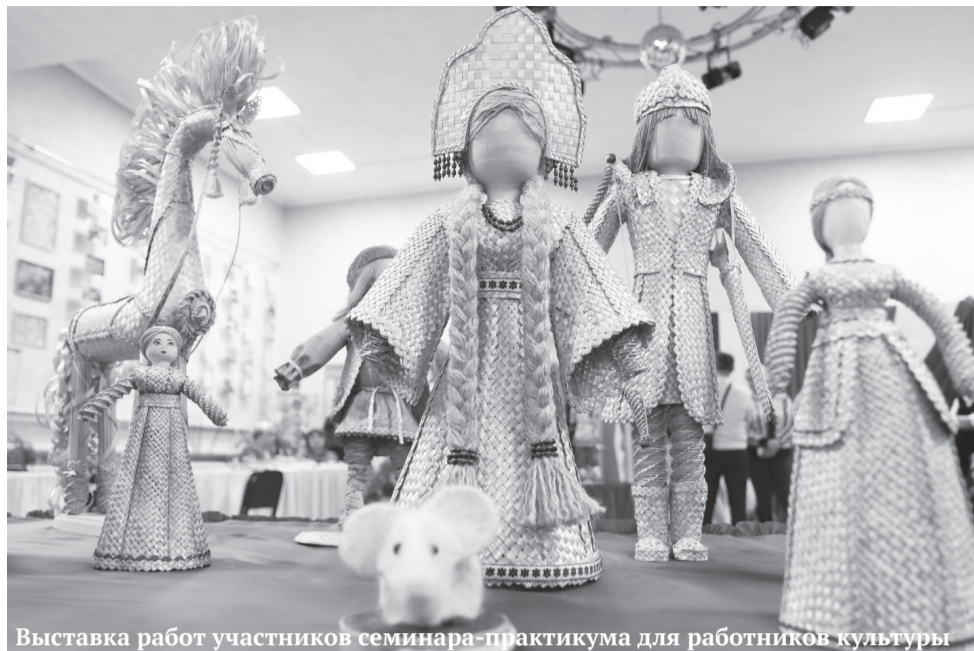
Выставка работ участников семинара-практикума для работников культуры