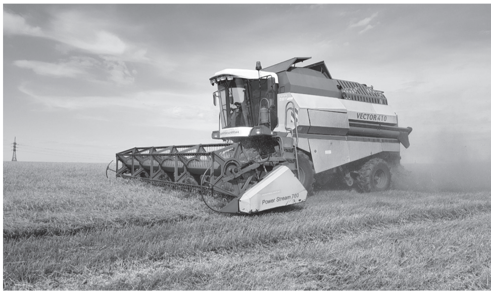
Уборка зерновых в разгаре

- Во время подготовки к реализации дополнительно подсушиваем зерно, чтобы понизить содержание влаги в нем и довести до товарного состояния,