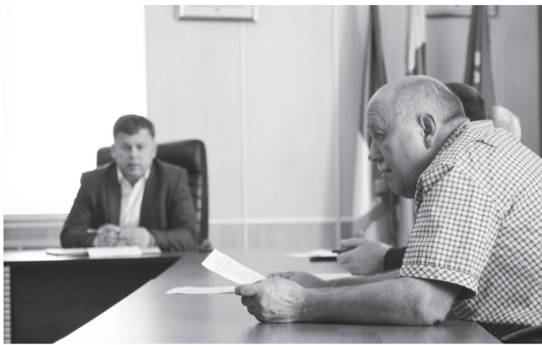
Во время совещания

- Очень много жалоб и претензий от жителей Черемховского района. Все они поступают на мое имя, и в каждой своя правда. Люди не понимают такого отношения к дорогам, и я, если честно, тоже. Наступил учебный год, нам нужны подготовленные школьные маршруты. Они должны быть прежде всего безопасными. К сожалению, в ходе моей последней оценочной поездки по всему району, я такого не увидел. Дороги в ужасном состоянии. В некоторых местах их и дорогами-то назвать сложно. После проливных дождей, месиво из глины и грязи – проехать становится практически невозможно. Дороги находятся в областном ведении, и повлиять на их финансирование не могу. Мне остается только слушать обоснованные претензии жителей и перенаправлять их. Со стороны