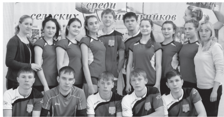
Юные волейболисты из Михайловки

Самым молодым является отделение велоспорта. Трениру-