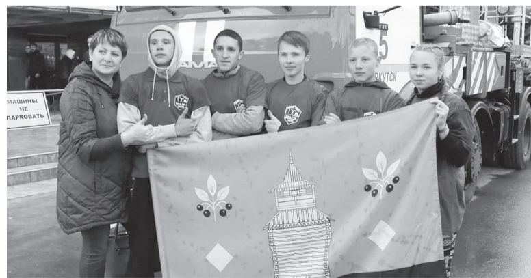
Команда Черемховского района на региональных соревнованиях