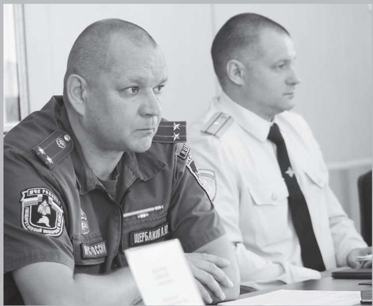
Во время заседания антинаркотической комиссии