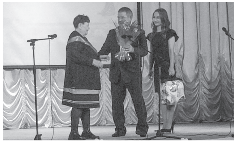
День села в Парфёново

Для каждого жителя сельской территории его малая родина значит очень многое. У любого населенного пункта есть своя история, традиции, природное достояние и люди – это ли не истинное богатство?