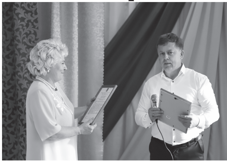
Празднование Дня села в Зерновом

Песнями, танцами, чтением стихов, посвященных малой родине и чествованием земляков, отметили День села жители Зернового в минувшую пятницу.