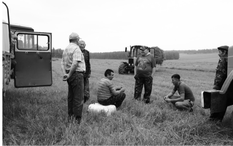
Полеводческая бригада ООО «Новогромовское»

Аграрии Черемховского района приступили к заготовке грубых кормов для КРС. В их числе ООО «Новогромовское». В текущем сезоне сельхозпредприятию предстоит заготовить более 150 тонн сена.