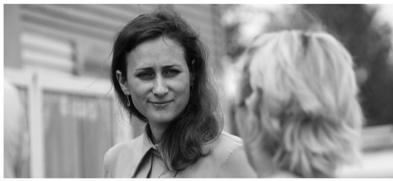
Разговор с жителями деревни Лохово

Потравы сельскохозяйственных культур животными, пасущимися без присмотра, являются серьезной проблемой сельского хозяйства. Скот способен уничтожить множество посевов и нанести огромный ущерб как мелким, так и крупным сельскохозяйственным товаропроизводителям. Сельхозники постоянно ведут жаркие споры с местным населением по поводу выпаса скота. И у каждого своя правда. Для разрешения этих споров и существует административная комиссия. Её задача - найти «золотую середину», разобраться и