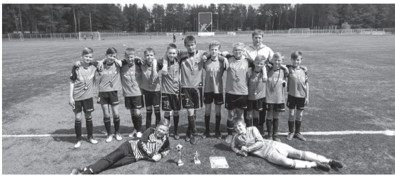
Михайловские футболисты приняли участие в двух важных турнирах

Начало лета у футболистов Михайловской ДЮСШ выдалось очень «жарким» и продуктивным. За две недели они приняли участие в двух первенствах Иркутской области, провели 13 тяжелейших матчей и в дождь, и в жару.