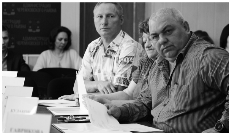
Депутаты в работе

«В связи с истечением срока полномочий Думы Черемховского районного муниципального образования шестого созыва и в соответствии с нормами статьи