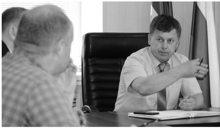
Совещание с дорожниками

По информации правительства Иркутской области, планом выполнения работ на 2019 год ОГКУ «Дирекция автодорог» предусмотрена разработка проектной документации на капитальный ремонт автодороги на участке с 33 по 43 км. При формировании планов работ по проектированию на 2020 год будет рассмотрена возможность включения участка с 76 по 90 км автодороги «Черемхово-Голуметь-Онот».