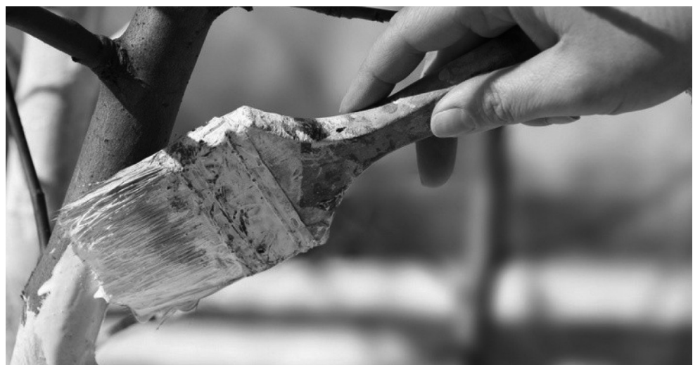
Срез тонкой ветки достаточно обработать садовым варом

Материалы подготовила: Ольга ГОНЧАРЕНКО