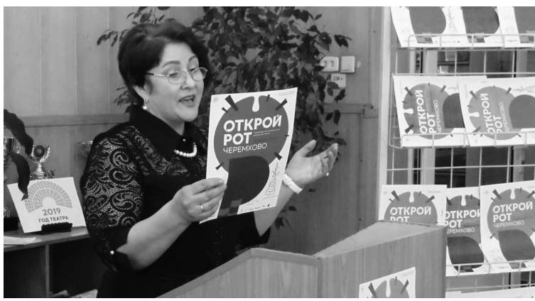
На начальном этапе конкурса