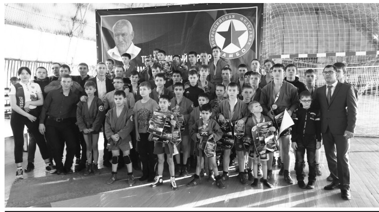
Команда михайловских самбистов и гости турнира