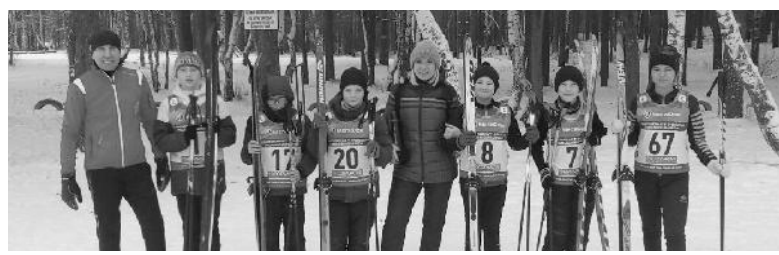
Команда михайловских лыжников