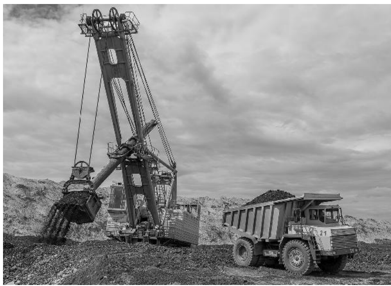
Процесс добычи угля