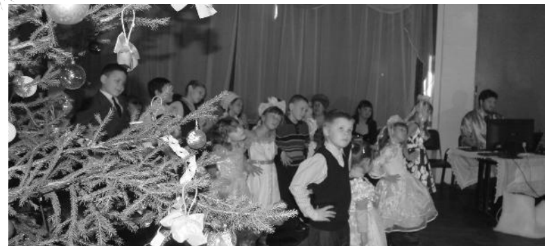
Около 60 детей приехали на ёлку в ДК «Горняк»