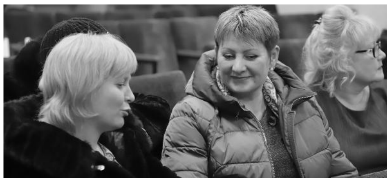
Сход в Алёхино