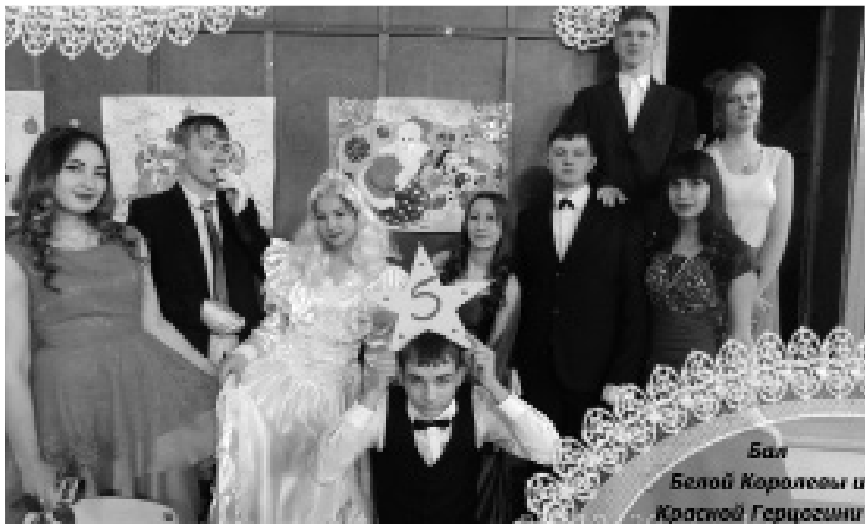
Бал Белой Королевы и Красной Герцогини