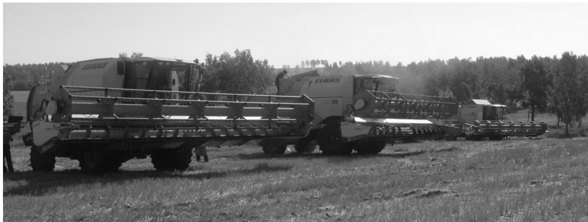
Данные предоставлены отделом сельского хозяйства ЧРМО.