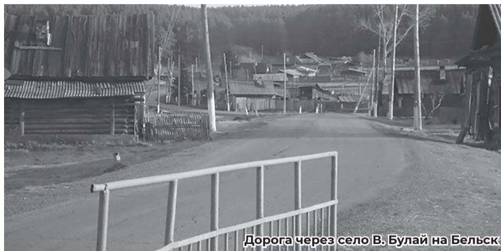
Дорога через село В. Булай на Бельск

Главные речные пути по рекам Белой, Большой Белой, Голумети способствовали образованию заимок, деревень. Между ними прокладываются грунтовые дороги объединяющие села, деревни, заимки.