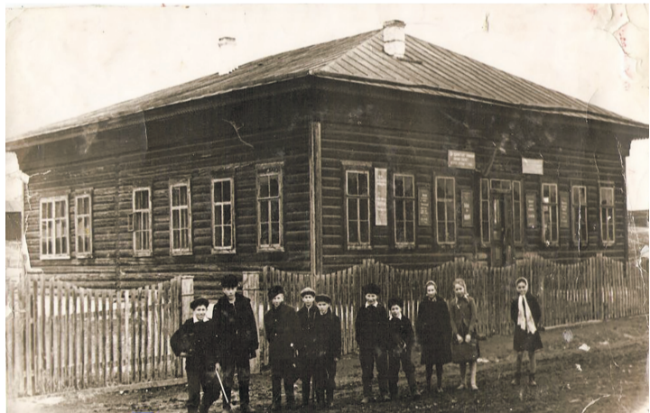
Продолжение в следующем номере «МС».