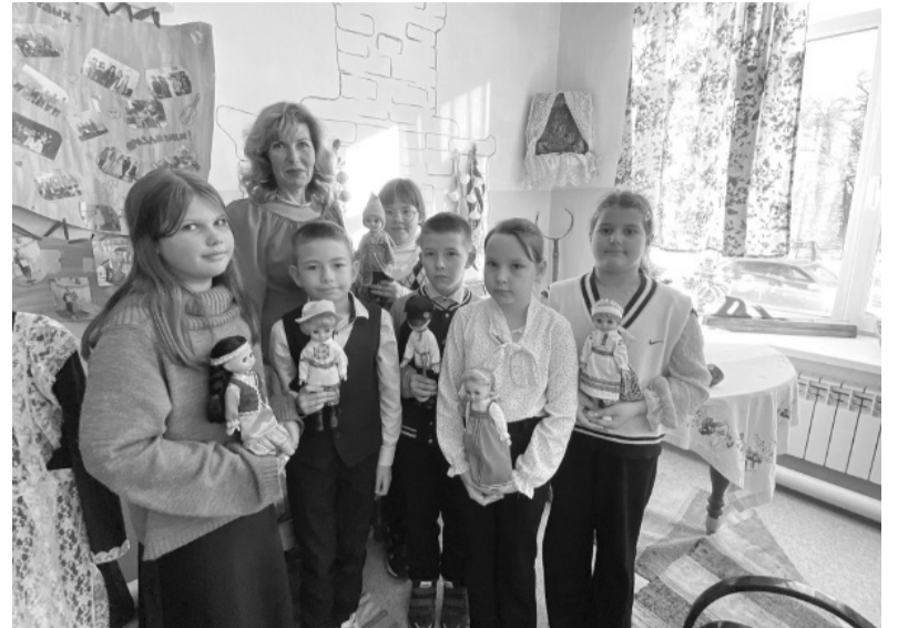
СОШ с. Новогромово.

У каждого народа есть свой язык, свои обычаи и традиции, и, конечно же, национальная одежда. Издавна народный костюм был ярким определителем национальной принадлежности человека. В костюме отражались история, особенности, художественно-эстетические идеалы каждого народа, его духовный мир. Народный костюм – это бесценное, неотъемлемое достояние культуры народа, накопленное веками. Одежда, прошедшая в своём развитии долгий путь, тесно связана с историей и эстетическими взглядами создателей. Народный костюм – не только яркий самобытный элемент культуры, но и синтез различных видов декоративного творчества, вплоть до середины XX века донёвшего традиционные элементы кроя, орнамента, использования материалов и украшений, свойственных русской одежде в прошлом. Именно этой теме посвящена виртуальная выставка в музейной комнате «Моя Малая Родина», которая прошла в МКОУ