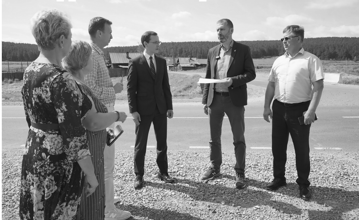
Качество ремонта дорог, выбор объектов, расстановка приоритетов — вот что в первую очередь интересует парламентариев в сфере дорожного строительства.

➔ - Какую конкретно поддержку может получить муниципалитет от областного парламента?