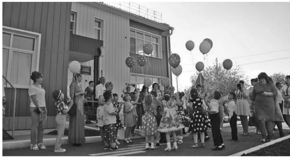
Детский сад «Тополёк» был построен в 2014 году. Здание рассчитано на 160 ребят. Есть музыкальный зал, спортзал, площадка для прогулок

Со своей проблемой новогромовчане куда только не обращались. В селе проживает около 900 человек, из них 180 - дети до 17 лет. Плюс в фельдшерско-акушерский пункт