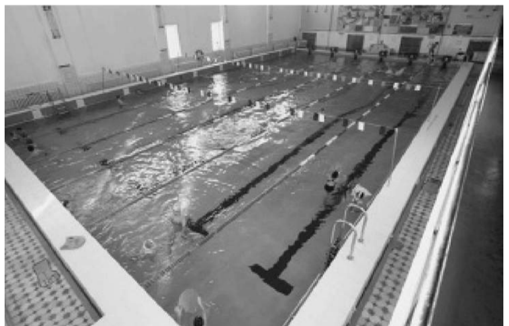
Спорткомплекс «Солнечный» в Братске - единственный крупный физкультурный объект в огромном Падунском районе, где проживает по меньшей мере 50 тысяч человек

К слову, ледовый корт КСК в Хомутово - это база для тренировок детской команды «Сибскана», а также собственной дружины малышей Хомутово «Медведи».