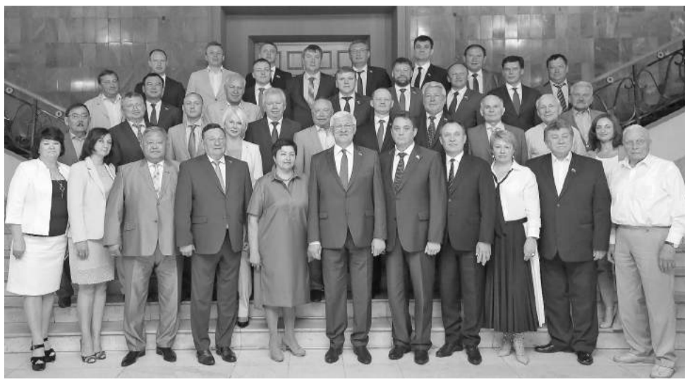
Законодательным Собранием Иркутской области второго созыва был взят курс на обновление спортивной инфраструктуры в регионе

Легендарный спортобъект появился в Усолье в 1997 году. Он служил резервной ареной для футболистов иркутской «Звезды» на чемпионате России, вмещал 10 тысяч