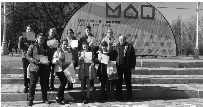
Делегация школьников от Иркутской области

Москва – это сплошной памятник! Даже хостел, в котором мы проживали, тоже памятник истории и культуры – это усадьба 18 столетия! А проживали мы в самом центре Москвы – на Таганке, где находится знаменитый театр, в котором с 1964 г. работал Владимир Высоцкий.