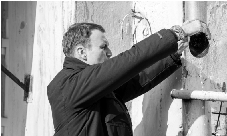
Мэр устраняет проблему с водостоком