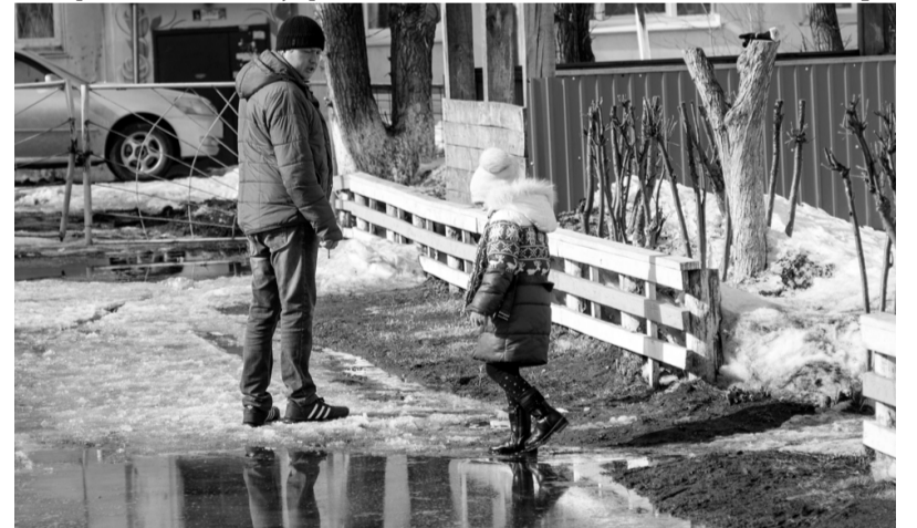
«Море разливанное» на территории ДОУ № 54