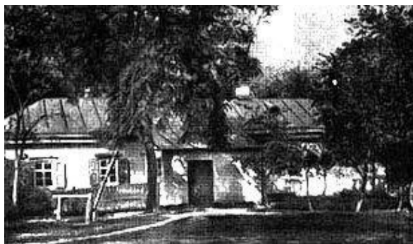
Дом доктора М.Я.Трохимовского в Сорочинцах, где родился Гоголь

Датой рождения Н. В. Гоголя принято считать 20 марта 1809 года (по новому стилю дата рождения – это 01 апреля 1809 года). Его малая родина — это небольшое поселение с названием Великие Сорочинцы, которое располагается в Миргородском уезде на Полтавской земле.